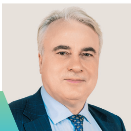
Павел ЗАВАЛЬНЫЙ, депутат Государственной Думы РФ

по качеству жизни среди регионов страны (рейтинг АСИ)