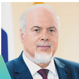
Вадим ШУВАЛОВ, депутат Государственной Думы РФ

по качеству жизни среди регионов страны (рейтинг АСИ)