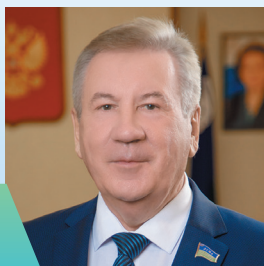
Борис ХОХРЯКОВ, председатель Думы Югры

Приобрели 30 спортплощадок «зима-лето», установили 3 площадки для сдачи норм ГТО